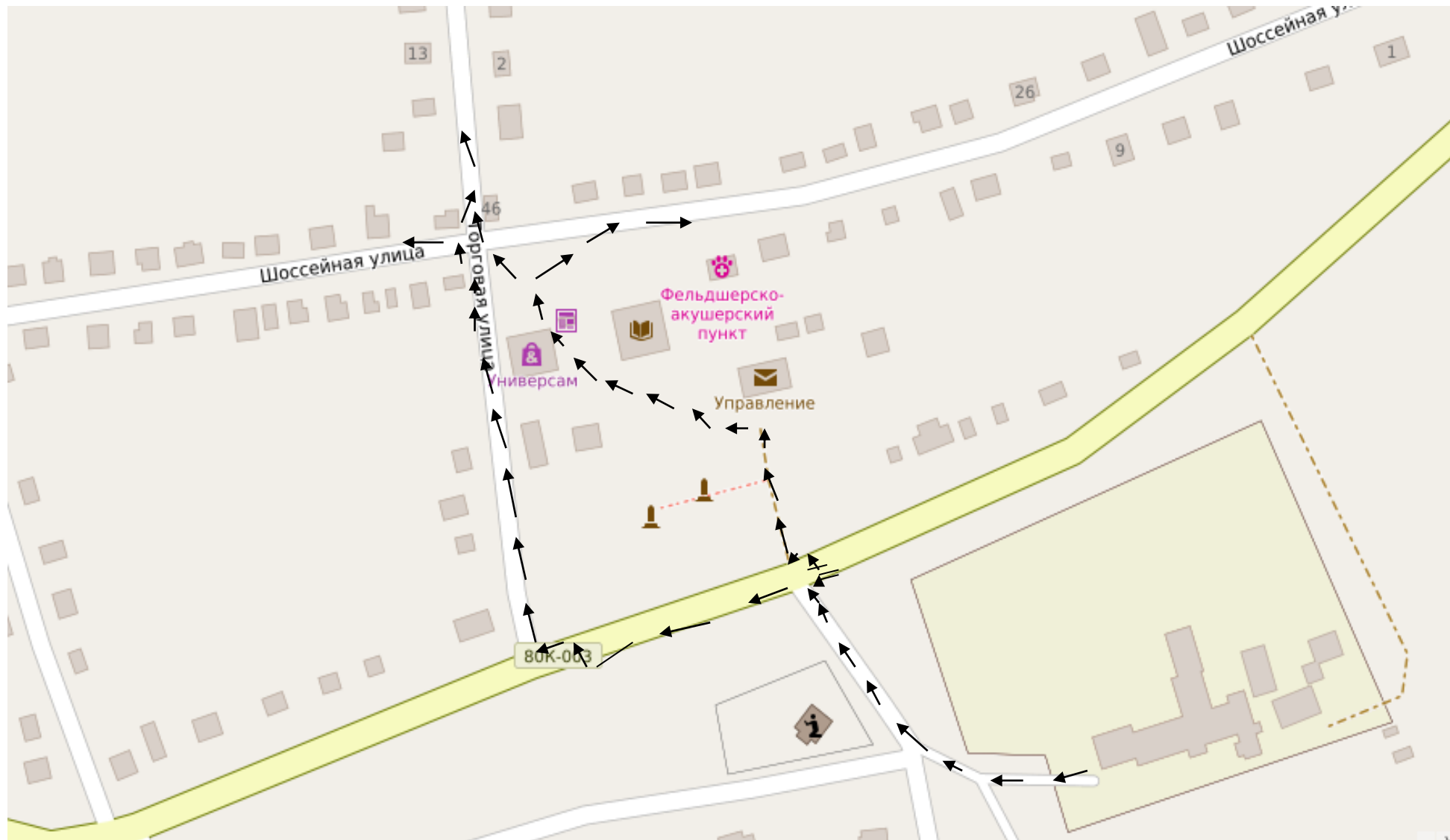
Схема безопасного перемещения учащихся МБОУ СОШ с.Кунакбаево